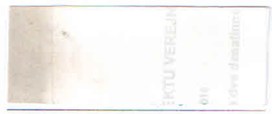
Pečiatka a podpis